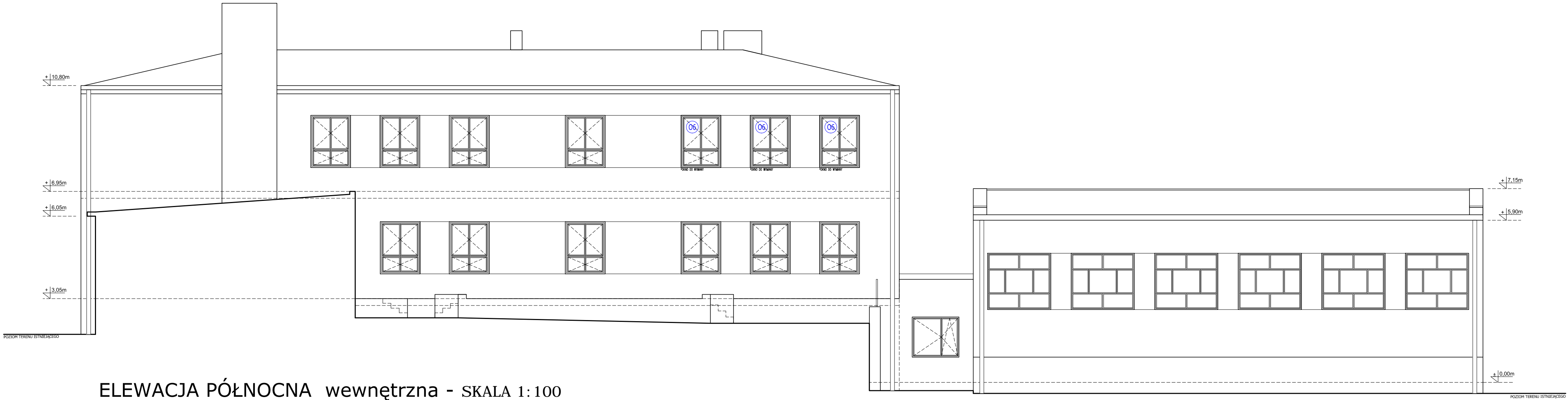
ELEWACJA PÓŁNOCNA wewnętrzna - SKALA 1:100